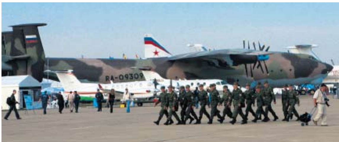
УНИКАЛЬНЫЙ ТРАНСПОРТНЫЙ САМОЛЕТ АН-22 СПОСОБЕН ПОДНЯТЬ В ВОЗДУХ 80 Т ГРУЗА. РАНЕЕ НА НЕМ ПЛАНИРОВАЛОСЬ ДОСТАВЛЯТЬ К СТАРТУ СОВЕТСКИЕ КОСМИЧЕСКИЕ ЧЕЛНОКИ «БУРАН»