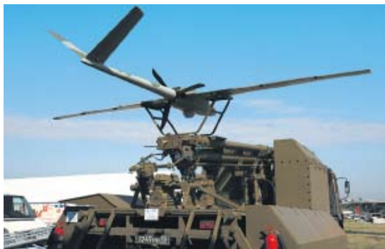
БЕСПИЛОТНИКИ МОГУТ НЕ ТОЛЬКО ОБНАРУЖИТЬ ЦЕЛЬ, НО И ПРИ НЕОБХОДИМОСТИ УНИЧТОЖИТЬ ЕЕ