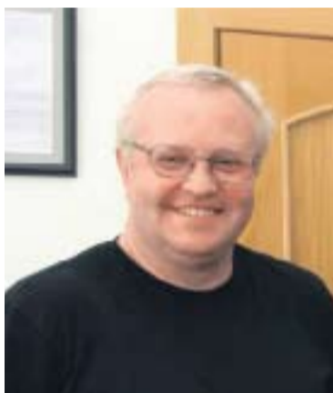
ЛИТОВСКИЙ РЕЖИССЕР ЛИНАС ЗАЙКАУСКАС

Здесь жива своя тайна. Сюда до сих пор нельзя иностранцам. И отсюда не так просто уехать, надо пройти какой-то унизительный шмон — отголосок то ли нынешнего статуса города, то ли его прошлого... Зато театр переполнен. Каждый вечер. И здесь не знают, что такое — нет зрелища. Это здорово! Театр — отдушина. Театр — выход в другую правду, которая не имеет ничего общего с