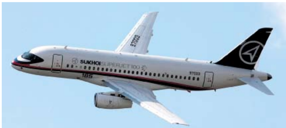
«СУХОЙ SUPERJET 100» — ПЕРСПЕКТИВНЫЙ СРЕДНЕМАГИСТРАЛЬНЫЙ ПАССАЖИРСКИЙ ЛАЙНЕР НОВОГО ПОКОЛЕНИЯ