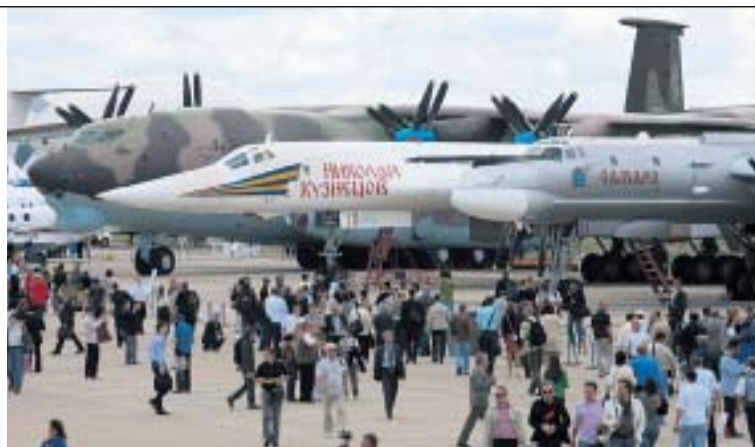
ВETERАН Ту-95МС И СВЕРХЗВУКОВОЙ Ту-160 — ОСНОВА СТРАТЕГИЧЕСКОЙ АВИАЦИИ РОССИИ

В публичные дни 21 — 23 августа, когда на МАКС смогут попасть все желающие, свое летное мастерство продемонстрируют пилотажные группы «Соколы России» из Липец-