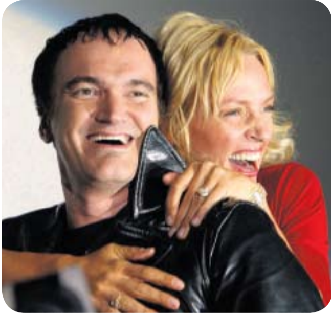
ПОСЛЕ «КРИМИНАЛЬНОГО ЧТИВА» УМА ТУРМАН СТАЛА НАСТОЯЩЕЙ МУЗЕЙ ТАРАНТИНО