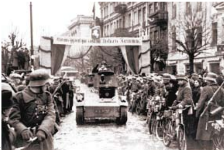
1939 г. ЛИТОВСКИЕ ВОЙСКА ВХОДЯТ В ПОЛЬСКИЙ ГОРОД ВИЛЬНО, ПЕРЕИМЕНОВАННЫЙ ЗАТЕМ В ВИЛЬНЮС, КОТОРЫЙ В НАСТОЯЩЕЕ ВРЕМЯ ЯВЛЯЕТСЯ СТОЛИЦЕЙ НЕЗАВИСИМОЙ ЛИТВЫ

Сегодня от России требуют покаяния за пакт Молотова — Риббентропа! Беспрецедентной лжи должен быть положен конец! ЛДПР — за организацию на государственном уровне общественной презентации всех реально существующих документов на эту тему. А постановление съезда нардепов СССР 1989 года должно быть пересмотрено справедливым правосудием! ■