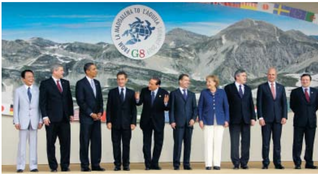
ЛИДЕРЫ «БОЛЬШОЙ ВОСЬМЕРКИ» ПОКА НЕ МОГУТ ВЫРАБОТОВАТЬ ЕДИННЫХ РЕЦЕПТОВ ПО БОРЬБЕ С КРИЗИСОМ. ВОЗМОЖНО, НА ПОМОЩЬ ПРИДЕТ УЧЕНИЕ КЕЙНСА

В таких условиях, очевидно, перейдут к секвестрированию бюджета. Урезание социальных расходов приведет к дальнейшему сокращению потребительского спроса в стране и сыграет на усиление кризиса. Уже в текущих условиях не планируется повышение зарплаты бюджетников и пособий по безработице. В 2010 году можно ожидать новый, более острый банковский кризис. За крахом автомобильной отрасли способны последовать обрушения иных отраслей экономики. ■