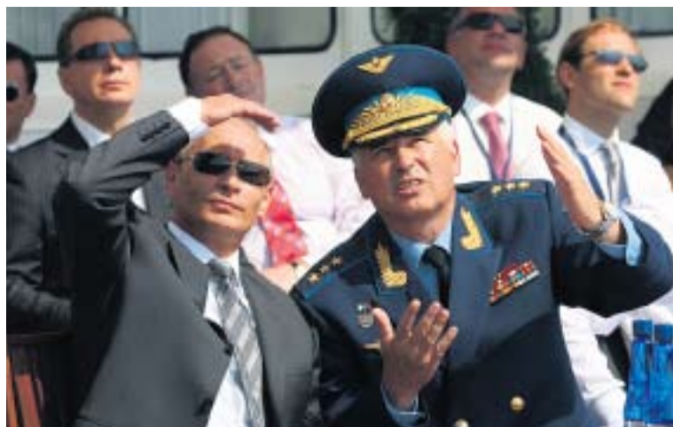
ГЛАВКОМ ВВС РОССИИ АЛЕКСАНДР ЗЕЛИН ДАЕТ ПОЯСНЕНИЯ ПОСТОЯННОМУ ГОСТЮ МАКСА ВЛАДИМИРУ ПУТИНУ