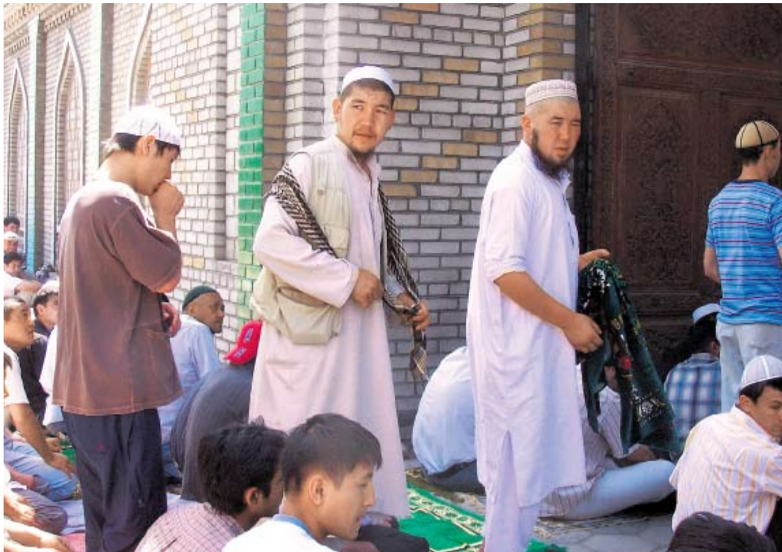
↑ КИРГИЗСКИЕ ТАБЛИГОВЦЫ ВЫДЕЛЯЮТСЯ СВОИМ ЭКЗОТИЧНЫМ ВИДОМ