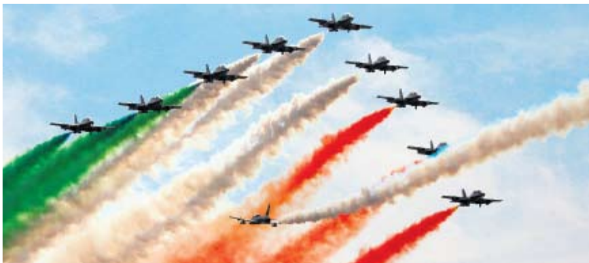
МАСТЕРСТВО В ВОЗДУХЕ ДЕМОНСТРИРУЕТ ИТАЛЬЯНСКАЯ ПИЛОТАЖНАЯ ГРУППА «ФРЕЧЧЕ ТРИКОЛОРЕ»

кого центра боевого применения и переучивания летного состава на самолетах Су-27 и Су-30, «Стрижи» на самолетах МиГ-29, а также иностранные гости — французская пилотажная группа «Патруль де Франс» и итальянская «Фречче Триколоре». В полетах помимо российских летательных аппаратов примут участие французский истребитель Rafale и итальянский военно-транспортный самолет С-27J Spartan.