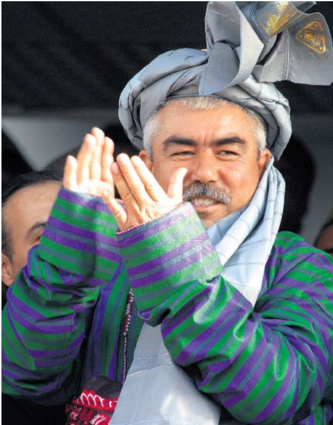
МОДЖАХЕД ДУСТУМ НЕ СКРЫВАЕТ СВОЕЙ СИМПАТИИ К РОССИИ И ДАЖЕ СОВЕТСКОМУ СОЮЗУ ↑

Россия укрепляет свое влияние в Афганистане