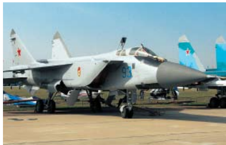
МИГ-31 ПРОИЗВОДИЛИ ЕЩЕ В СССР. СЕЙЧАС НАЧИНАЕТСЯ ЕГО ВТОРАЯ ЖИЗНЬ. САМОЛЕТ ПРЕДНАЗНАЧЕН ДЛЯ ОТРАЖЕНИЯ УГРОЗЫ ИЗ КОСМОСА