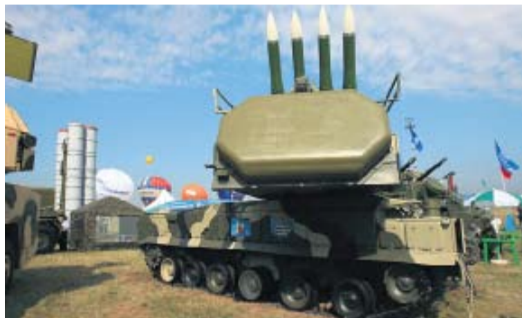
С-300ПМУ2 «ФАВОРИТ», ЗРК «БУК-М2Э», ЗРПК «ТУНГУСКА» — НАИБОЛЕЕ ЭФФЕКТИВНЫЕ СИСТЕМЫ ПВО В МИРЕ

кого центра боевого применения и переучивания летного состава на самолетах Су-27 и Су-30, «Стрижи» на самолетах МиГ-29, а также иностранные гости — французская пилотажная группа «Патруль де Франс» и итальянская «Фречче Триколоре». В полетах помимо российских летательных аппаратов примут участие французский истребитель Rafale и итальянский военно-транспортный самолет С-27J Spartan.