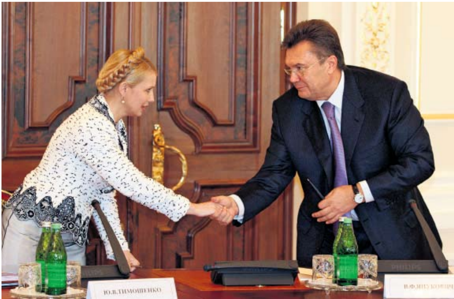
ДОСТИЖЕНИЕ КОМПРОМИССА МЕЖДУ ТИМОШЕНКО И ЯНУКОВИЧЕМ ВПОЛНЕ ВОЗМОЖНО