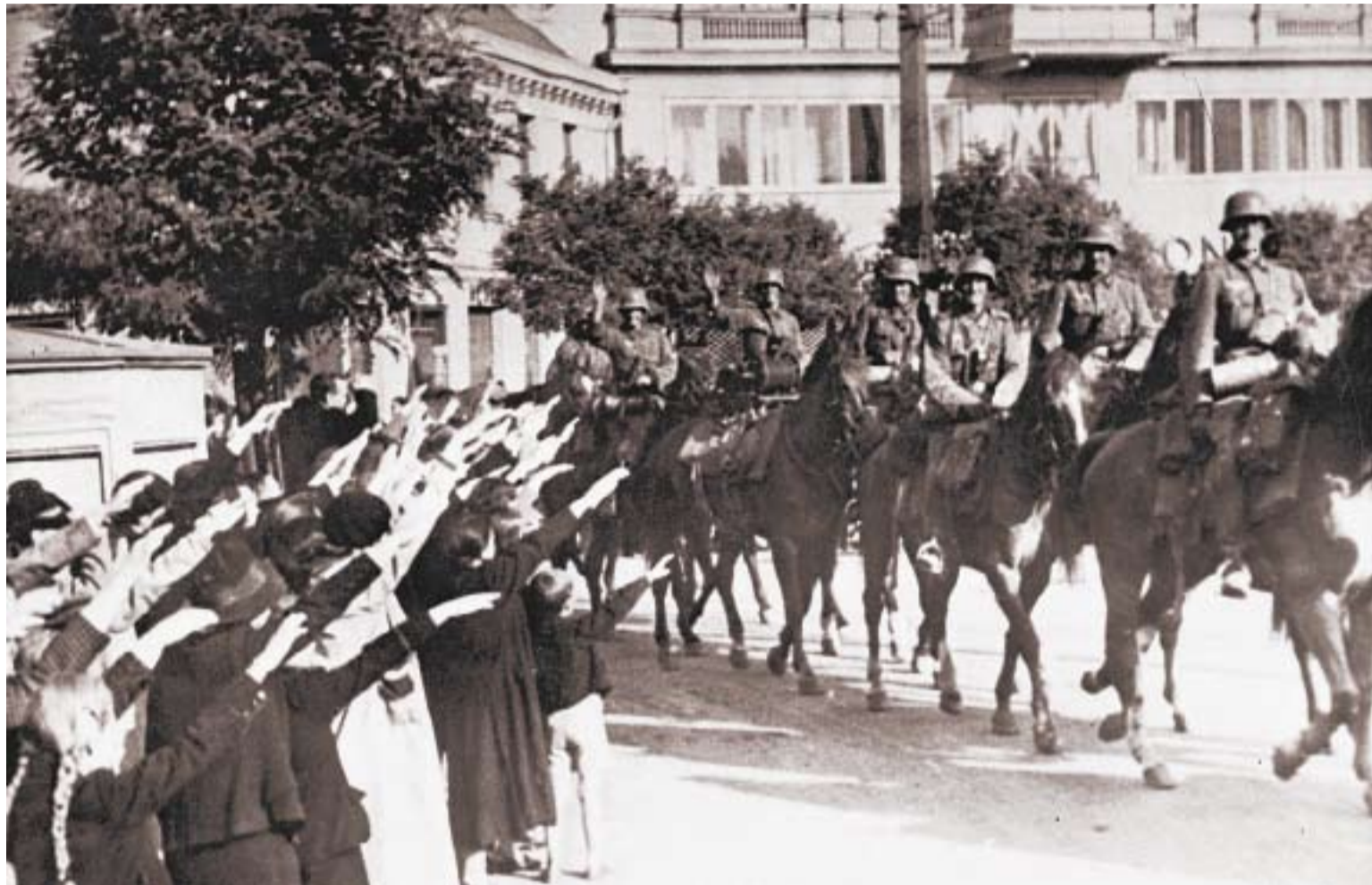
ЖИТЕЛИ ПОЛЬСКОЙ ЛОДЗИ ВСТРЕЧАЮТ НЕМЕЦКИЕ ВОЙСКА. 1939 г. ➔

с 21-й стр. ➔ Между тем опыт гражданской войны в Испании в Кремле хорошо помнят. Да и во время Мюнхена подобный сценарий уже был опробован: подписавшие приговор Чехословакии державы уведомили Прагу, что если она примет советскую помощь и будет сопротивляться, то начавшаяся война «сразу превратится в войну со всей Европой». Ситуация усугубляется тем, что на Дальнем Востоке Советскому Союзу придется воевать с входящей в Анतिकоминтерновский пакт Японией.