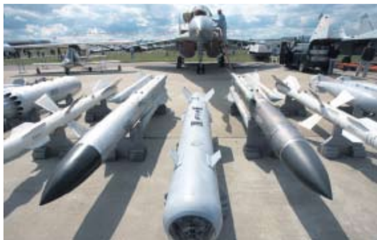
СОВРЕМЕННЫЙ МНОГОЦЕЛЕВОЙ ИСТРЕБИТЕЛЬ МОЖЕТ НЕСТИ РАКЕТЫ ДЛЯ ВЫПОЛНЕНИЯ САМЫХ РАЗЛИЧНЫХ ЗАДАЧ

Все эти факты свидетельствуют о том, что государство наконец начало уделять самое серьезное внимание повышению боеспособности Вооруженных сил и поддержке