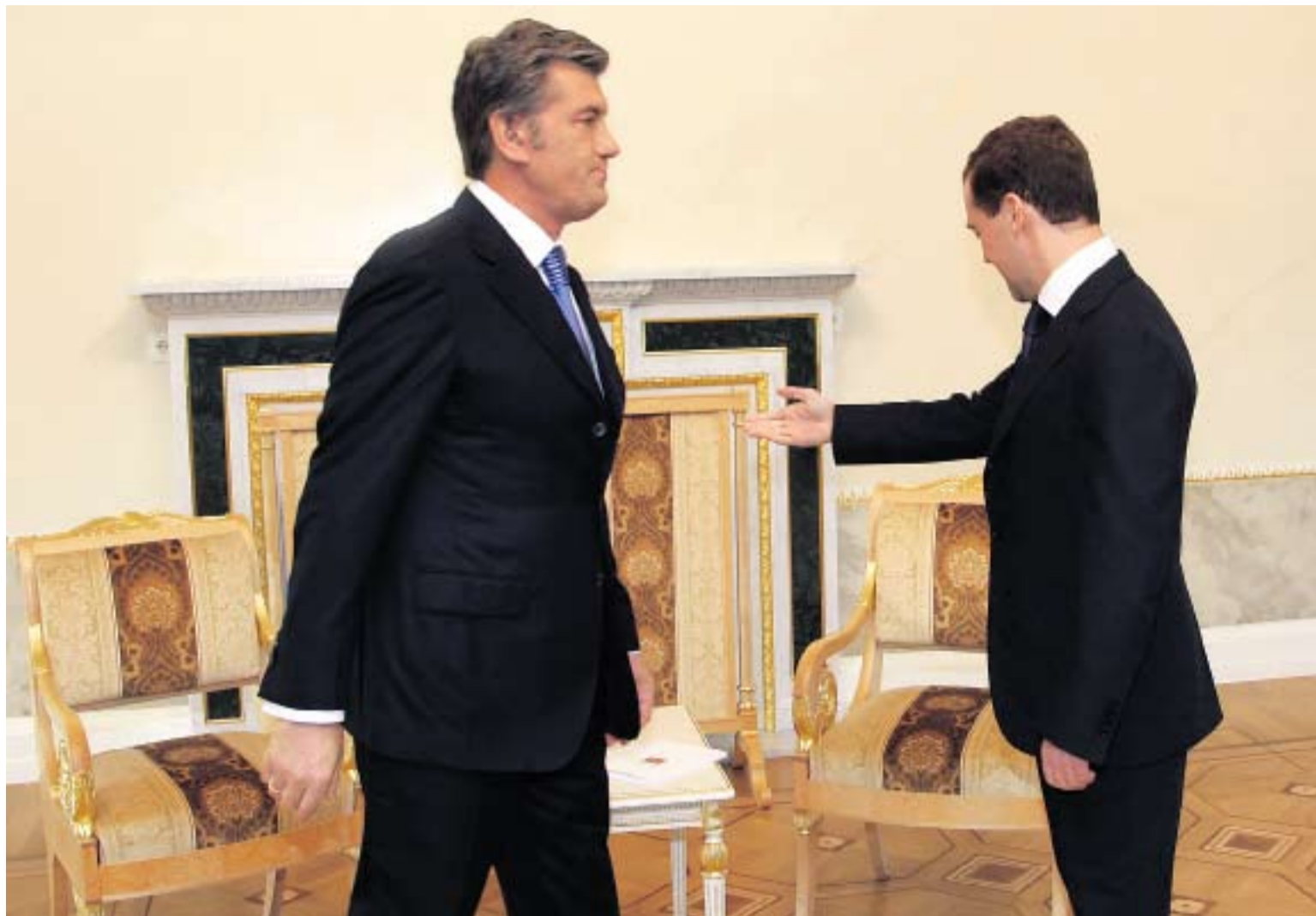
▲ ДМИТРИЙ МЕДВЕДЕВ УКАЗАЛ ВИКТОРУ ЮЩЕНКО ЕГО МЕСТО