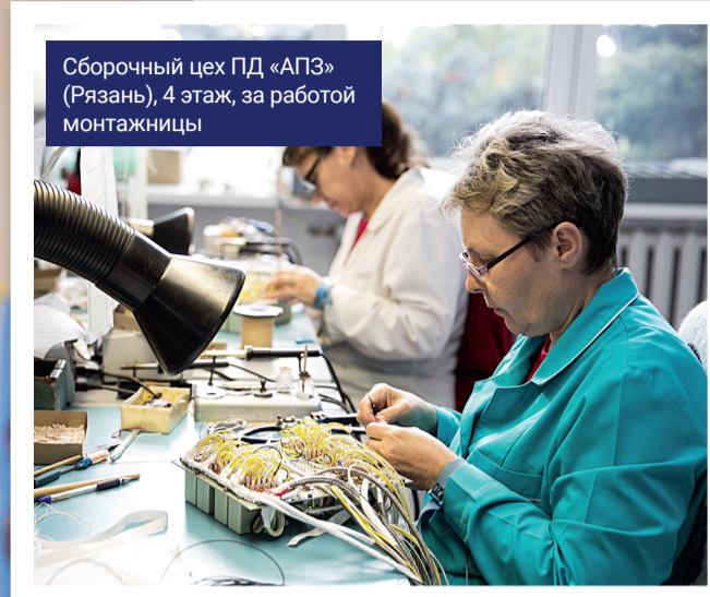
Сборочный цех ПД «АПЗ» (Рязань), 4 этаж, за работой монтажницы