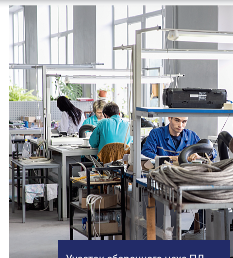
Участок сборочного цеха ПД «АПЗ» (Рязань), монтажники и монтажницы за сборочными столами